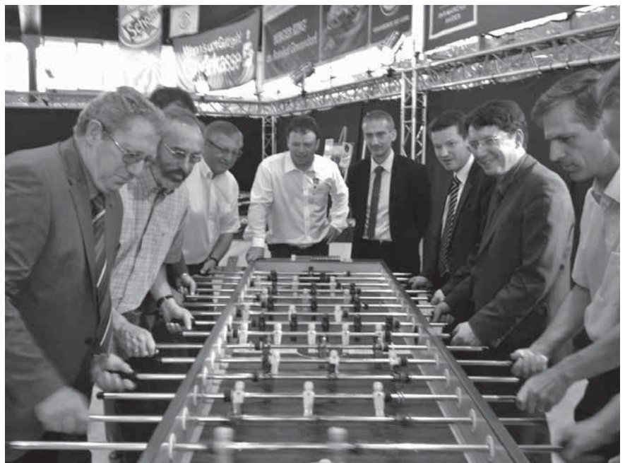
Messestand der Barmherzigen Brüder Gremsdorf (Gewerbeschau 2011)