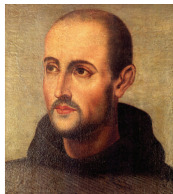
Hl. Johannes von Gott Gründer des Ordens der Barmherzigen Brüder

Besuchen Sie unseren neu konzipierten Internetauftritt unter www.barmherzige-gremsdorf.de