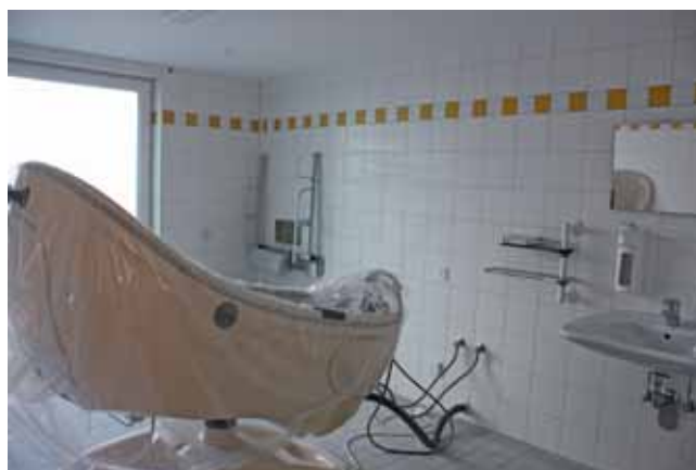
Das Badezimmer ist fast fertig

Sie haben mit Sicherheit den Bau des neuen Wohnheimes Frater Sympert Fleischmann das letzte Jahr gespannt verfolgt.