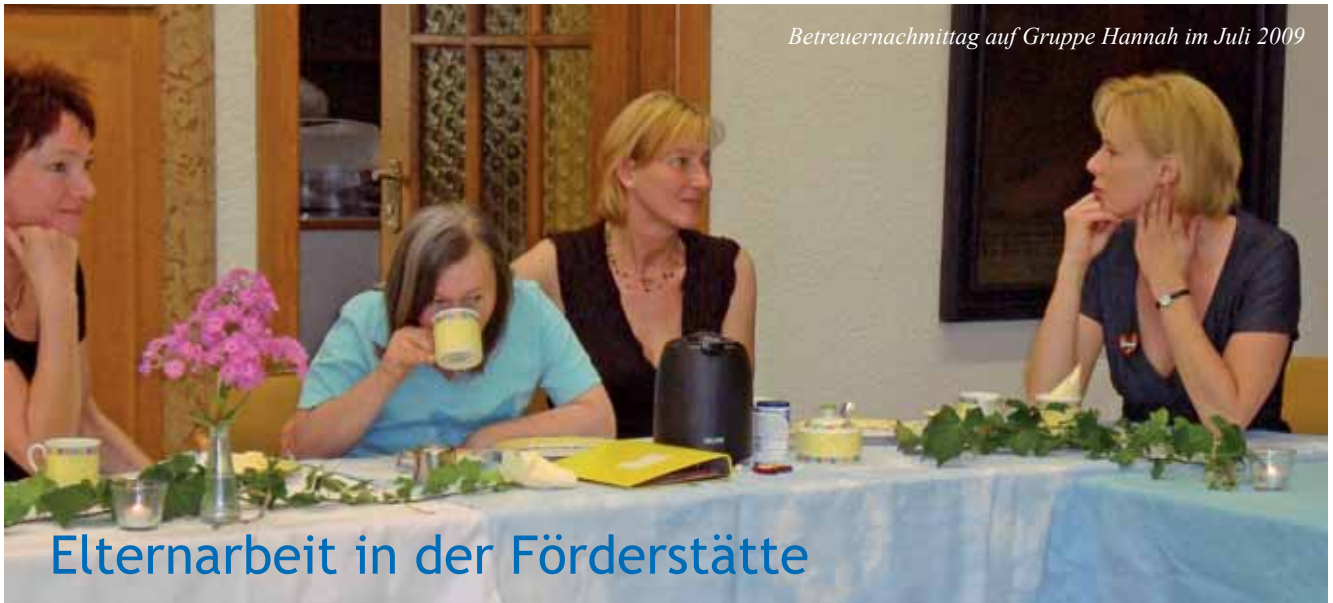
Betreuernachmittag auf Gruppe Hannah im Juli 2009