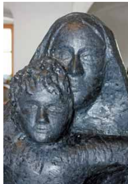
Maria mit Jesus

Nun ist die eigentliche Arbeit von Mario Schosser fertig und die Figur wird in die Gießerei gebracht. Dort wird sie zunächst mit Silikon, einem flüssigen Kunststoff, der an der Luft härtet, abgeformt. Durch das Silikon können auch die kleinsten Vertiefungen genau sichtbar gemacht werden. Bei der Silikonform spricht man dann von der „Negativform“, die man dazu benutzt, eine „positive Wachsform“ zu erstellen. Zusätzlich werden Wachskanäle an der Figur angebracht, damit sich später die Bronze bis in die letzten Winkel verteilen kann. Diese Wachsform wird anschließend in ein Gipsbett getaucht