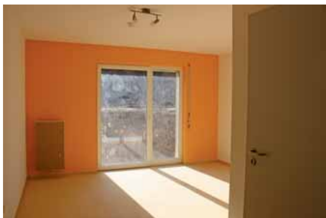
Blick in ein Zimmer