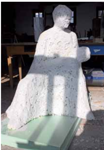
Johannes von Gott