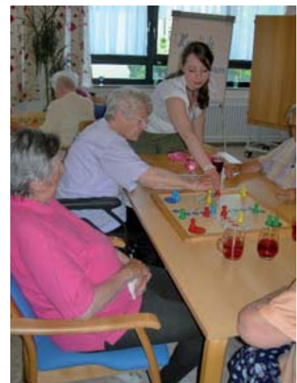
„Mensch ärgere dich nicht“ und ganz viel Spaß