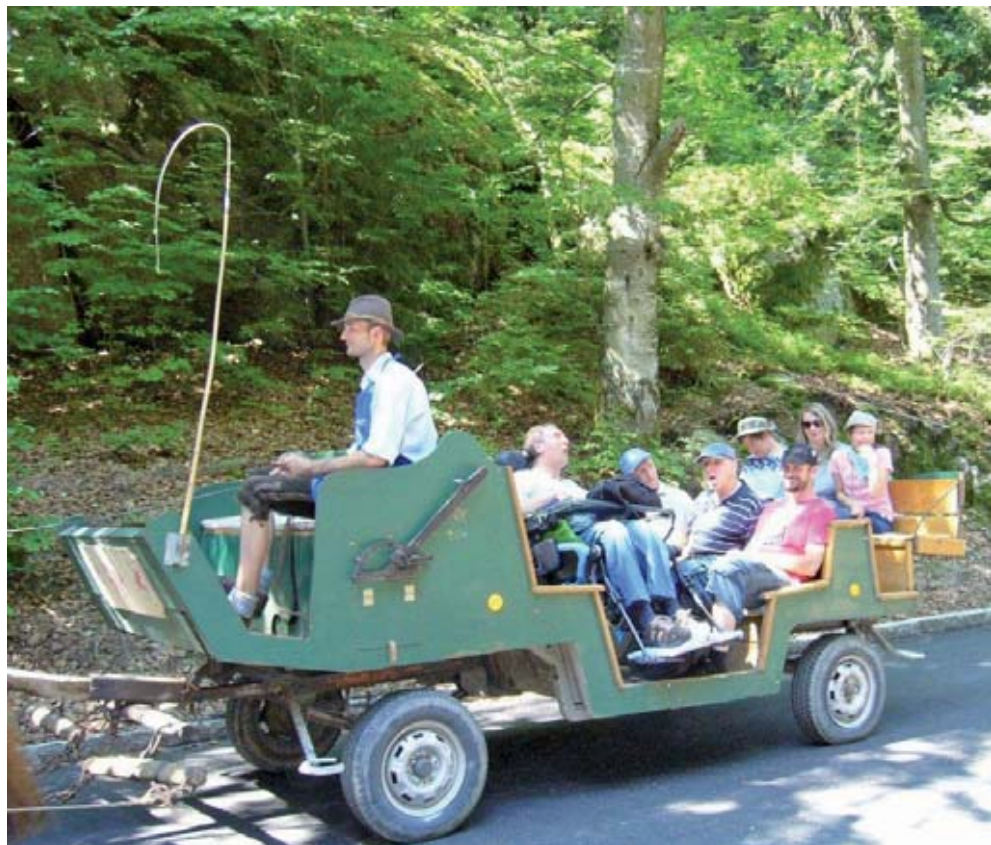
Eine Kutschfahrt, die ist lustig