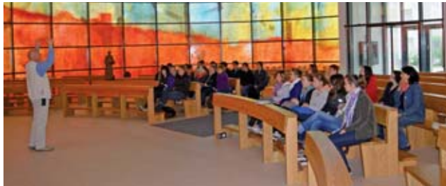
Nach der Hospitation in Förderstätte und WfbM erhielten die Schüler eine Führung in unserer Kirche.

„Na und... Niemand ist perfekt“ – unter diesem Motto veranstaltet das Anton Bruckner – Gymnasium (ABG) in Straubing seit dem Jahr 2003 Projektstage in Kooperation mit verschiedenen Einrichtungen der