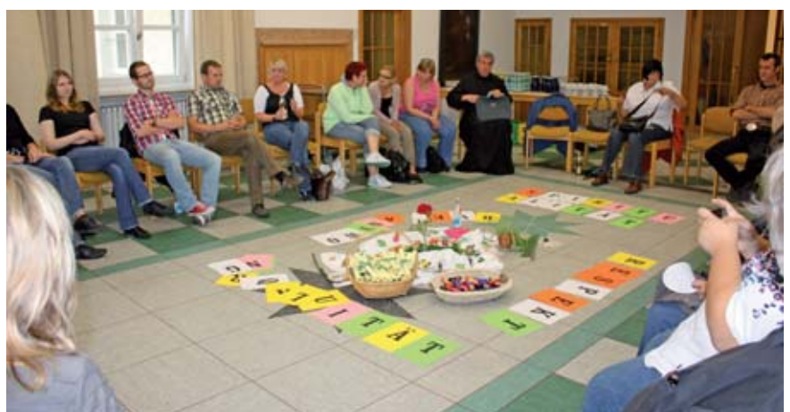
Buchstabenpuzzle mit Werten des Ordens

Wider Erwarten wird an diesem Tag nicht nur gebetet und gesungen, vielmehr beschäftigen wir uns mit un-