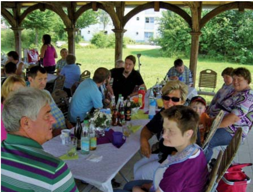
Geschichten und nette Gespräche

... hieß es am 03. Juni 2011 bei herrlichem Wetter und strahlendem Sonnenschein zum 1. Betreuerfest von Gruppe Vinzenz. Unterm Pavillon der Einrich-