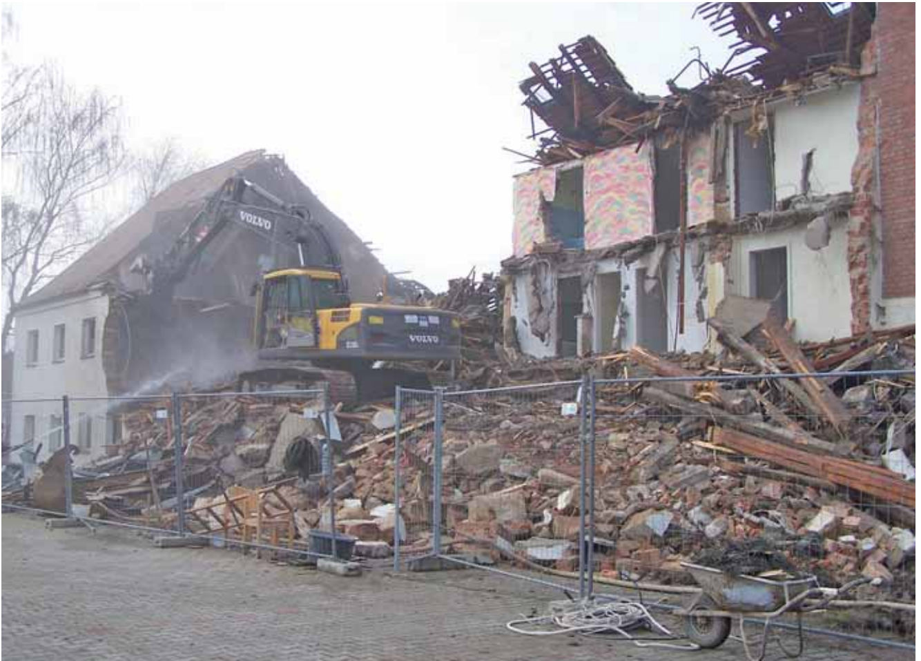
„Unser“ altes Zollnerhaus