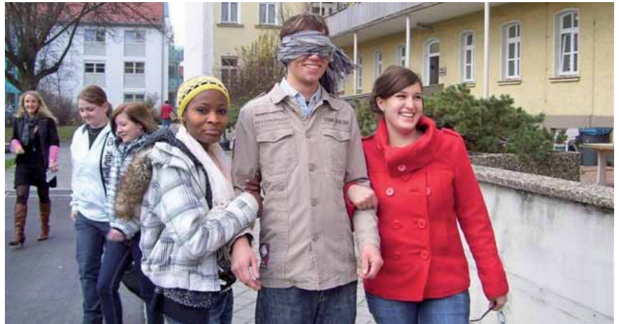
Eine Selbsterfahrungsübung zum Thema „Vertrauen“