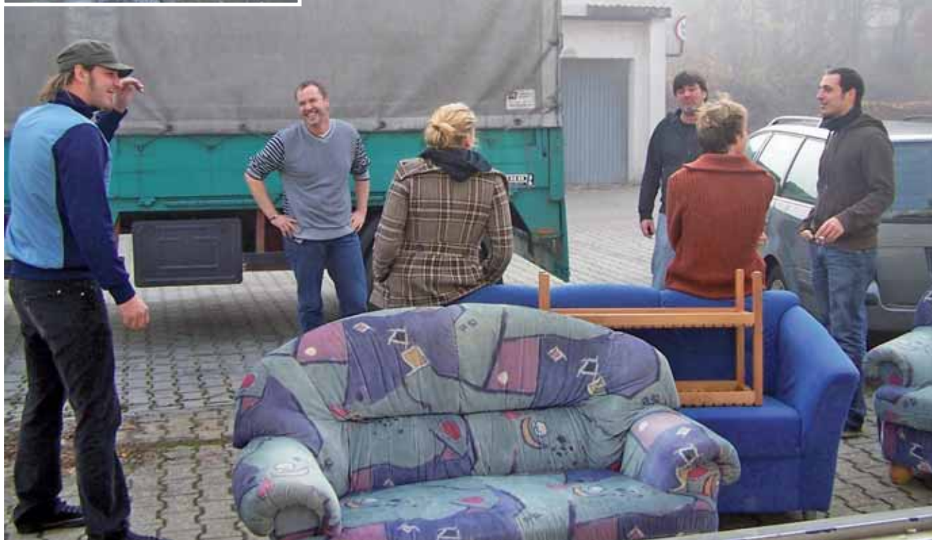
Alles muss raus!