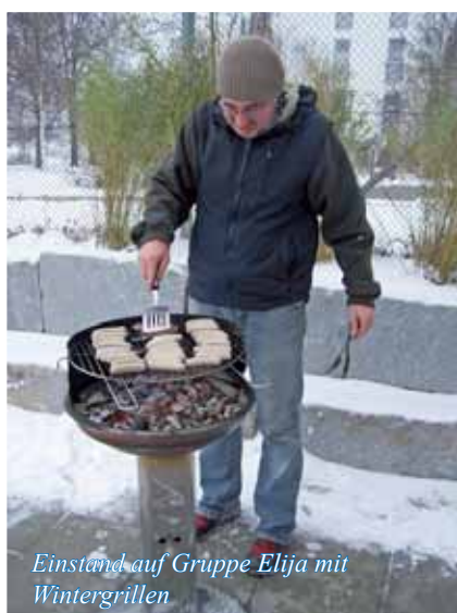
Einstand auf Gruppe Elija mit Wintergrillen