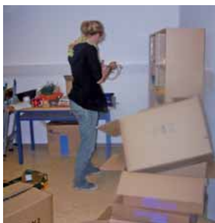
Die Kisten stapeln sich und wollen ausgeräumt werden