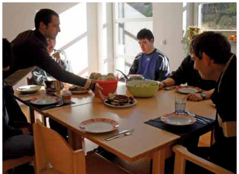
■ Einstand auf Gruppe Bruno mit Schweinebraten