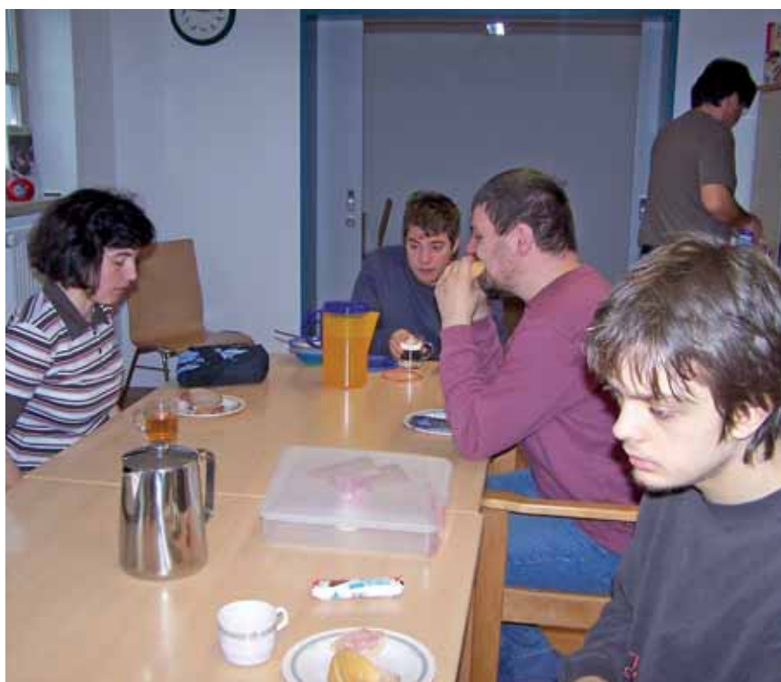
Brotzeit in den neuen Räumen