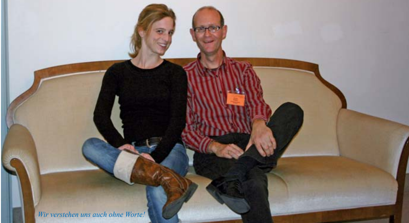
Wir verstehen uns auch ohne Worte!