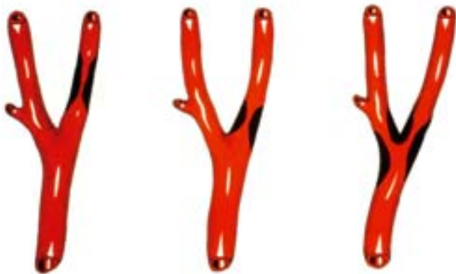
Verengung der Halsschlagader an verschiedenen Stellen

Mit die häufigste Ursache für einen Schlaganfall ist eine Verengung der Halsschlagader (Carotisstenose) im Rahmen einer Gefäßverkalkung (Atherosklerose). Partikel, die sich aus der Verkalkung lösen, führen zum Verschluss hirnversorgender Arterien und damit zum Schlaganfall.