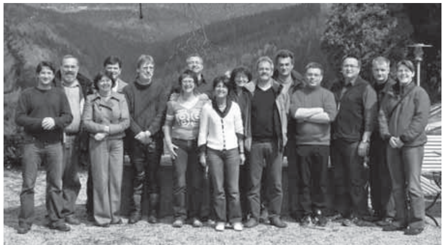
Die MAV in Klausur in Kostenz im April 2008.

MAV war jedoch stets bemüht, nach bestem Wissen und Gewissen, jeden nicht nur als Mitarbeiter oder Mitglied einer Abteilung zu sehen. Vielmehr stand der Mensch im Mittelpunkt unserer Arbeit. Sich für die Belange, Probleme und Nöte der einzelnen Mitarbeiter einzusetzen, war eine der Stärken dieser MAV. Diese MAV war aber auch sehr selbstkritisch, hat ihre Entscheidungen immer hinterfragt, hat sich nie gescheut Verantwortung zu übernehmen. Sie war immer zugänglich für Anregungen und Vorschläge und vor allem war diese MAV immer offen und ehrlich.