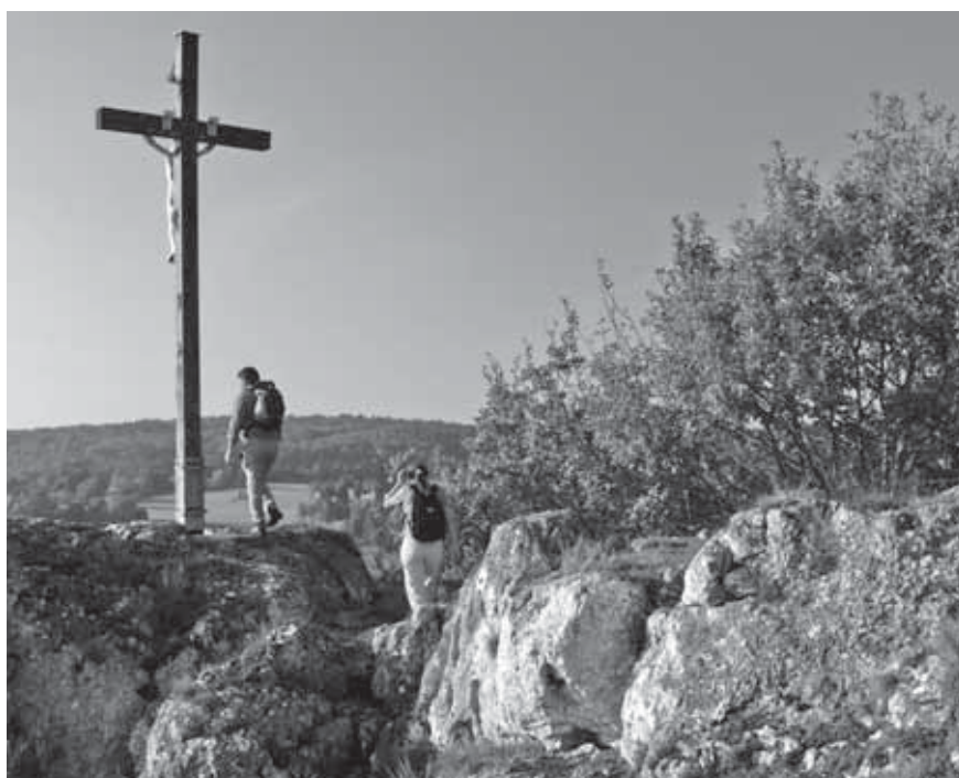
Der Alpine Steig oberhalb von Schönhofen im Labertal gehört zu den attraktivsten Wanderwegen bei Regensburg.