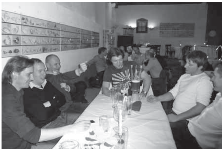
Nach der Siegerehrung im Restaurant "Leerer Beutel" herrschte eine ausgezeichnete Stimmung.