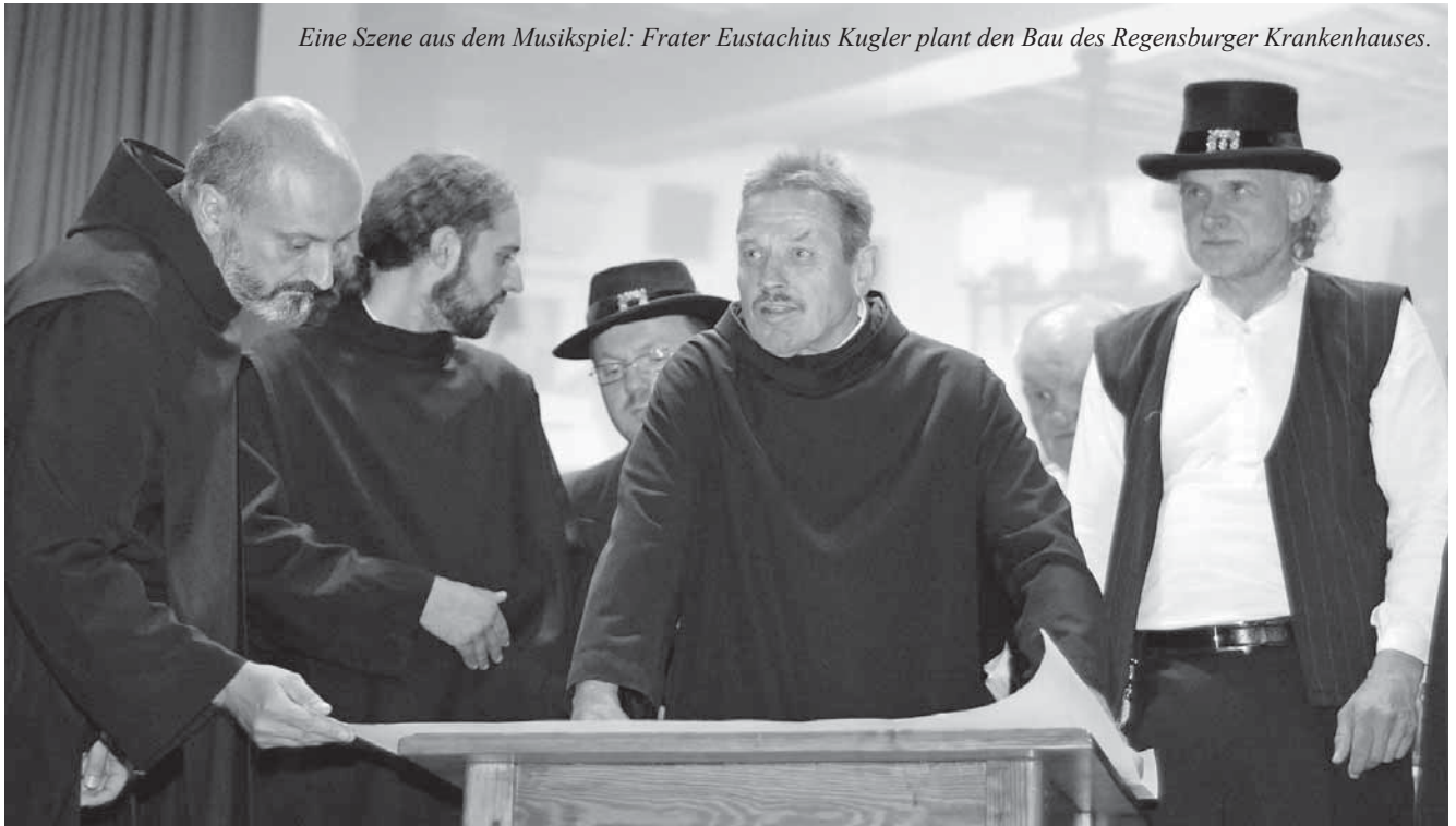
Eine Szene aus dem Musikspiel: Frater Eustachius Kugler plant den Bau des Regensburger Krankenhauses.

Nach überwältigendem Erfolg kam das Musikspiel über das Leben des seligen Frater Eustachius Kugler am 29. Oktober nun auch nach Regensburg. Das Musiktheater ist ein integratives Projekt – mit auf der Bühne waren Menschen mit Behinderung aus der Einrichtung der Barmherzigen Brüder Reichenbach.