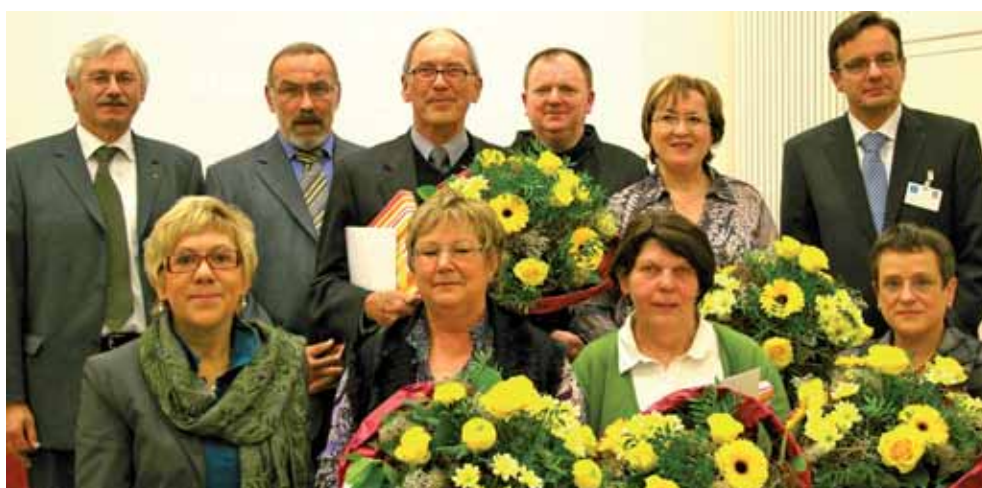
Stolze 40 Jahren sind diese Mitarbeiter ein Teil der Dienstgemeinschaft.