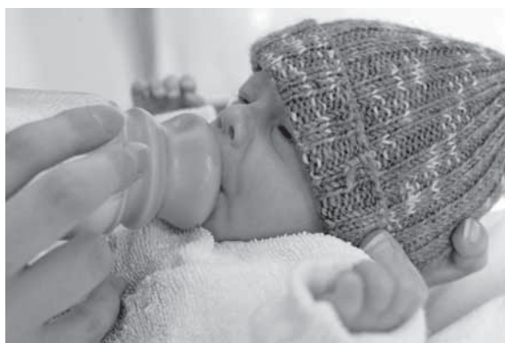
Ist das Frühchen noch zu schwach, um selbstständig Muttermilch aus der Brust zu trinken, so kann die Mutter ihm auch abgepumpte Milch im Fläschchen geben.

Die Mütter werden deshalb motiviert, ihre Milch abzupumpen, wenn das Kind noch nicht selbst saugen kann, da Muttermilch nach wie vor die beste Ernährung für die Frühgeborene ist. Sie ist reich an wertvollen Inhaltsstoffen wie