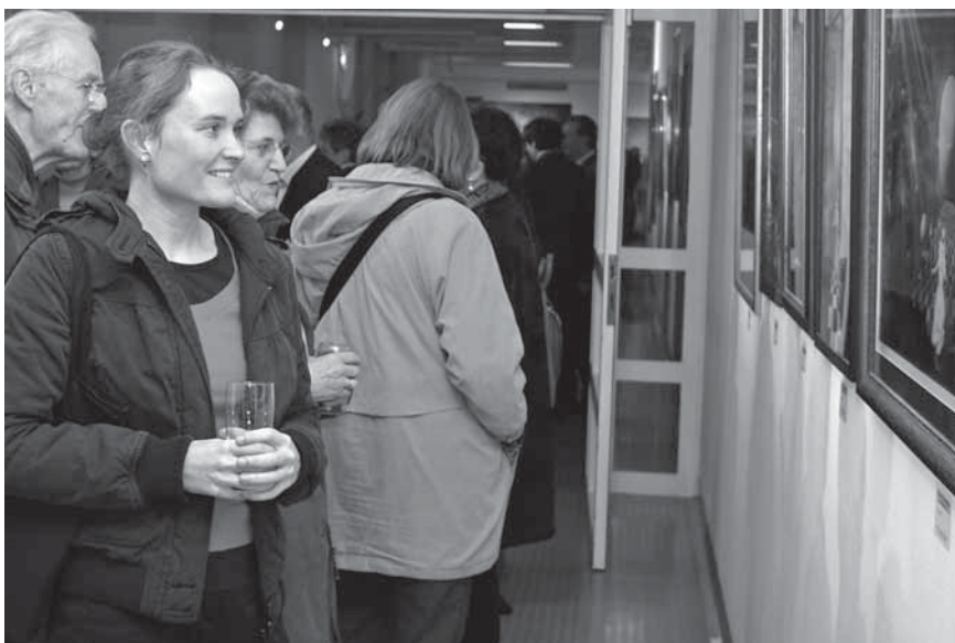
Die Besucher der Vernissage betrachten interessiert die Bilder.