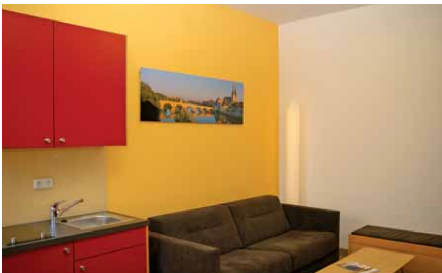
Das neu gestaltete Wohnzimmer mit einer Panoramaansicht von Regensburg.

Besondere Belastungen begleiten ihre Tage: Schmerzen, Angst, Unsicherheit und Sorgen – auch die Angehörigen befinden sich in einer Ausnahmesituation. So sollten die räumlichen Bedingungen Anspannung und Angst lösen, eine freundliche und wohnliche Atmosphäre schaffen und gleichzeitig dem Fachpersonal optimales Arbeiten ermöglichen. Für die Umgestaltung stand ein klar definiertes Budget des Vereins zur Förderung des Krankenhauses der Barmherzigen Brüder und der Palliativarbeit e.V. zur Verfügung.