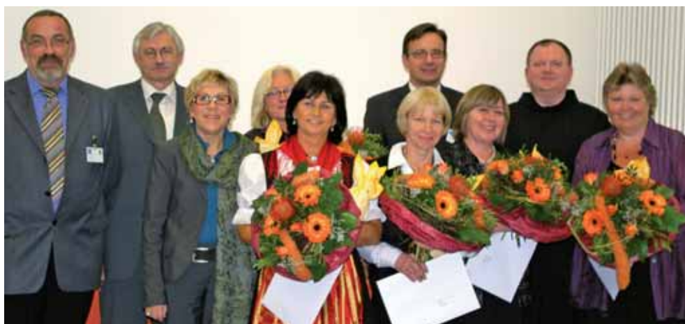
Nunmehr 35 Jahre halten diese Kollegen dem Krankenhaus ihre Treue.