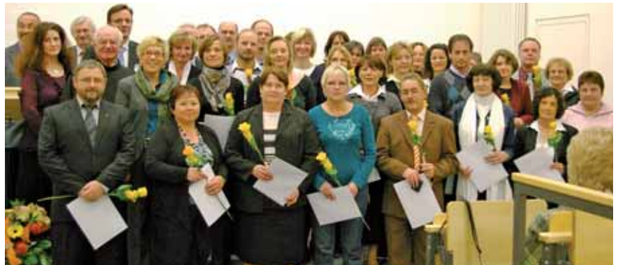
Ein 20-jähriges Jubiläum feierten diese Mitarbeiter.