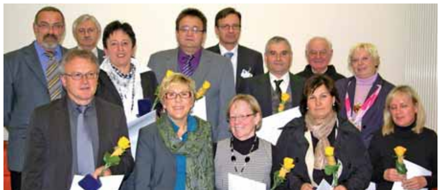
Ganze 30 Jahre sind diese Mitarbeiter für die Barmherzigen Brüder aktiv.