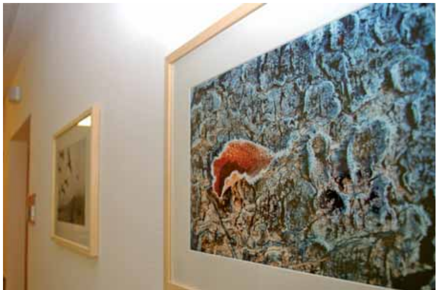
Ruhige Fotomotive des Fotografen Uwe Moosburger setzen auf dem Gang Akzente.

Anhand des Andachtsraumes soll dieser Prozess kurz dargestellt werden: Nachdem eine Andacht für verstorbene Patienten nur alle vier bis sechs Wochen stattfindet, ein „Raum der Stille“ den Patienten und Angehörigen jedoch täglich zur Verfügung steht, musste letzterer Funktion bei den gestalterischen Überlegungen unbedingt mehr Stellenwert als bisher beigemessen werden. In einem „Raum der Stille“ soll die Raum-