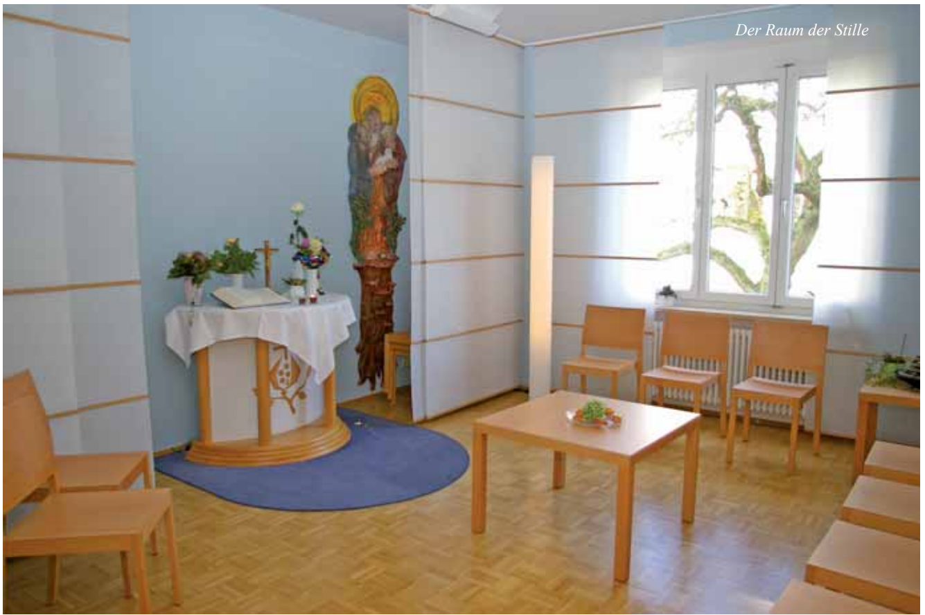
Der Raum der Stille