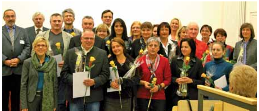
Seit 25 Jahren engagieren sich diese Kollegen für die Dienstgemeinschaft.