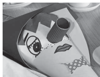
Ein Willkommensgruß für jeden.

Auch die zweiten Klassen unserer Berufsfachschule haben ein besonderes Lob verdient, denn sie gestalteten das Einstandsfest mit lustigen Spielen, schmackhaften und reichlichen Leckerbissen sowie einem gut vorbereiteten Einstandsgottesdienst. An dieser Stelle