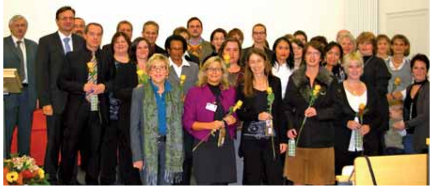
Seit 10 Jahren arbeiten diese Mitarbeiter für die Barmherzigen Brüder Regensburg.