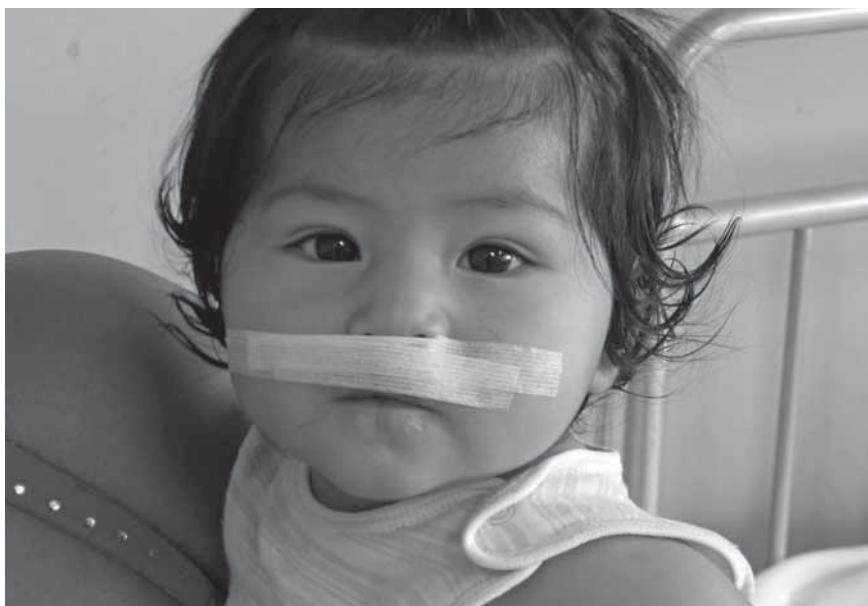
Eine kleine Patientin nach der geglückten Operation.

Ohrgänge, Nasenmissbildungen). Des Weiteren sehen wir unzureichend behandelte Verbrennungen und entsprechende Kontrakturen. Auch größere Hauttumore behandelt das Team.