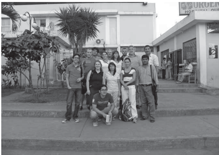
Das Team erholt sich von der anstrengenden Arbeit bei einem kleinen Stadtbummel.

Bereits direkt nach der Anreise können wir im Hospital de Quevedo mit der Sichtung der Patienten beginnen. Das resultierende Operationsspektrum beläuft sich im Wesentlichen auf Missbildungen im Lippenbereich und Gaumenspalten, auf Missbildungen an Händen und Füßen (doppelte Daumen, Hexadaktylien und ähnlichem), sowie weitere Gesichts- und Körpermissbildungen (fehlende Ohrmuscheln oder