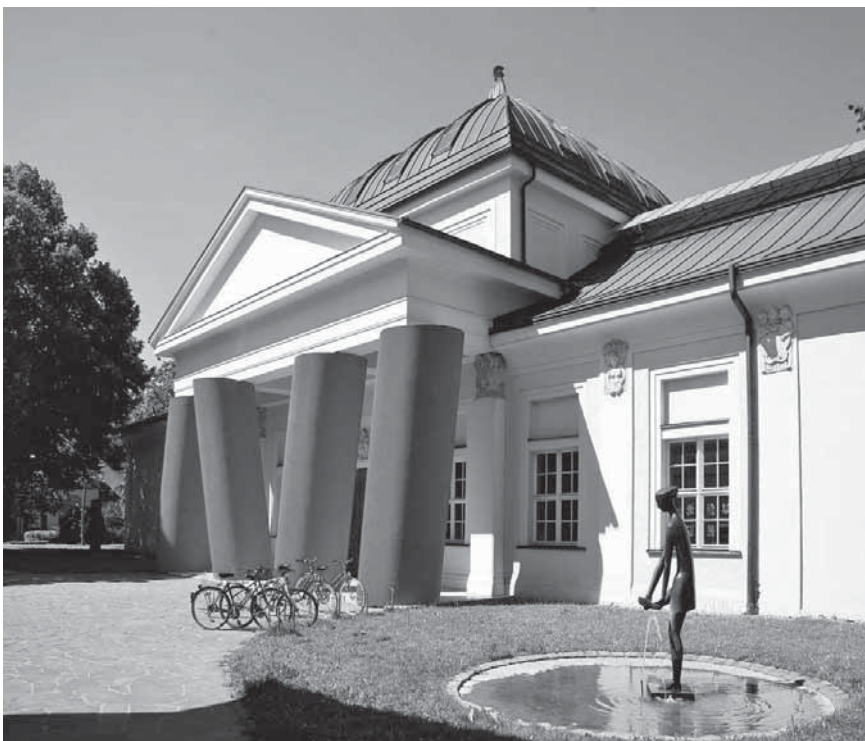
Das Kunstforum Ostdeutsche Galerie im Regensburger Stadtpark zeigt Spitzenwerke deutscher Kunst im östlichen Europa zwischen Romantik und Gegenwart.