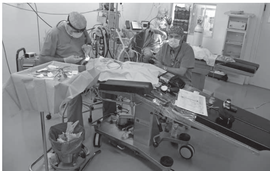
Höchste Konzentration im Operationssaal.

Interplast e.V. Sektion München koordiniert die Einsätze mit dem Auswärtigen Amt, dem Ministerium für wirtschaftliche Zusammenarbeit und diversen „Non Government Organisationen“ (NGO) wie Help, AWD-Kinderhilfe, Noma e.V. und den Gesundheitsbehörden im jeweiligen Land.