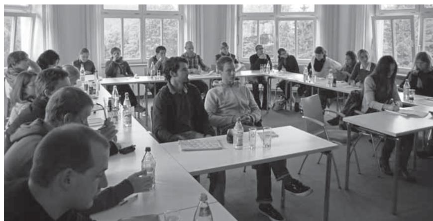
Gespannt hören die PJ-ler den Vorträgen zu.