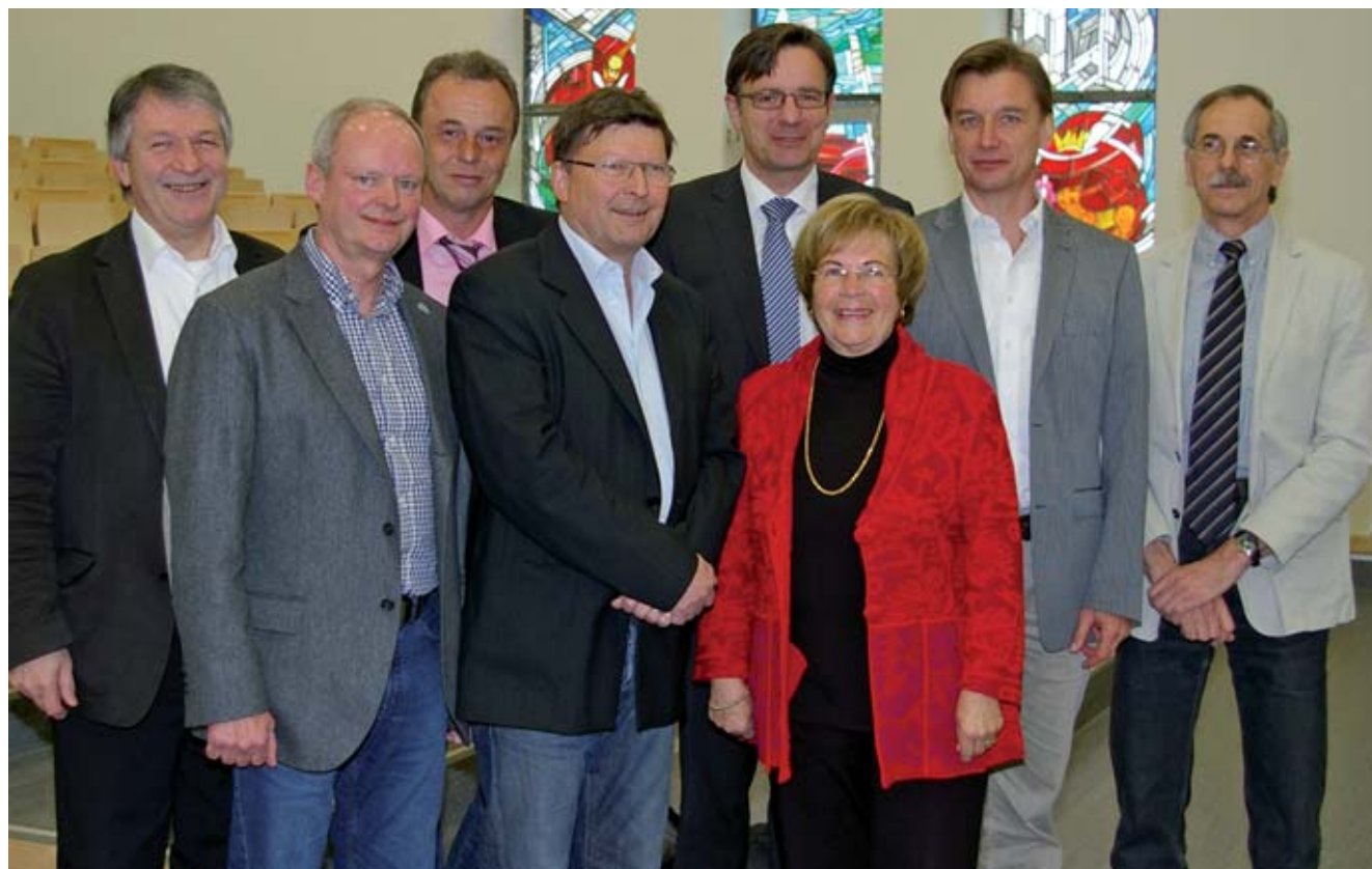
Die Referenten am 1. Ostbayerischen Tag der Allgemeinmedizin sprachen neben fachlichen auch berufspolitische Fragestellungen an.