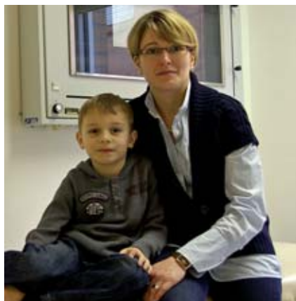
Mutter und Kind bei der Nachuntersuchung im Krankenhaus.