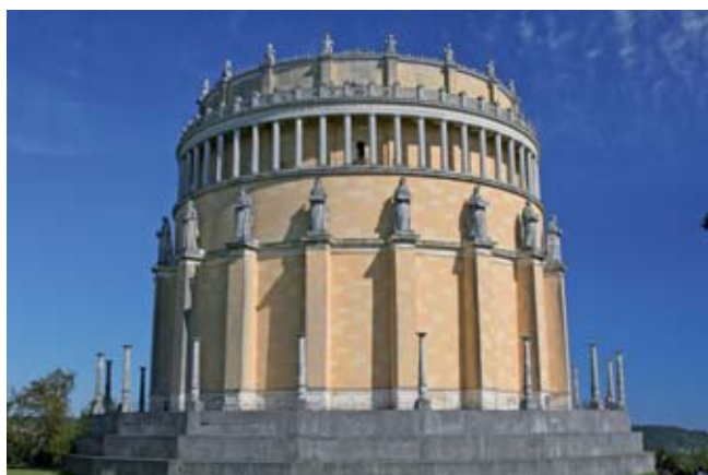
Die Befreiungshalle in Kelheim.